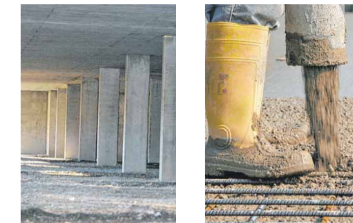
Einige Impressionen von der Entstehung bis zur Fertigstellung der drei Mehrfamilienhäuser in Baidt. Auf dem Foto in der Mitte Angelika und Matthias Schützbach.